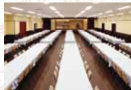
コンベンションホール